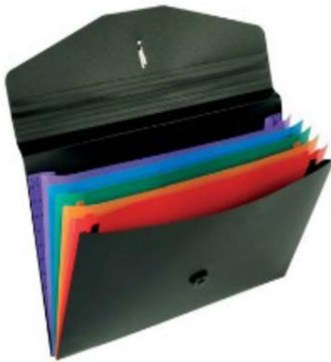
TRIEUR SOUFFLET 5 POSITIONS RAINBOW Ref.17967 595 F