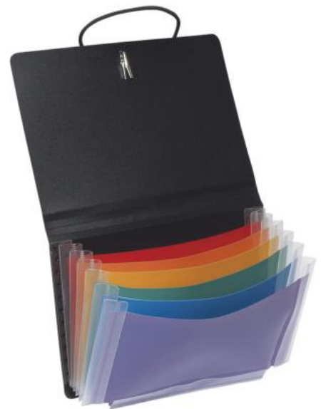
TRIEUR EXTENSIBLE 7 POSITIONS MATIERE : PROPYGLASS Ref.118383