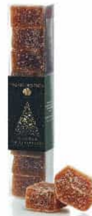
Pâtes de Fruit Mirabelle et Thé du Hammam