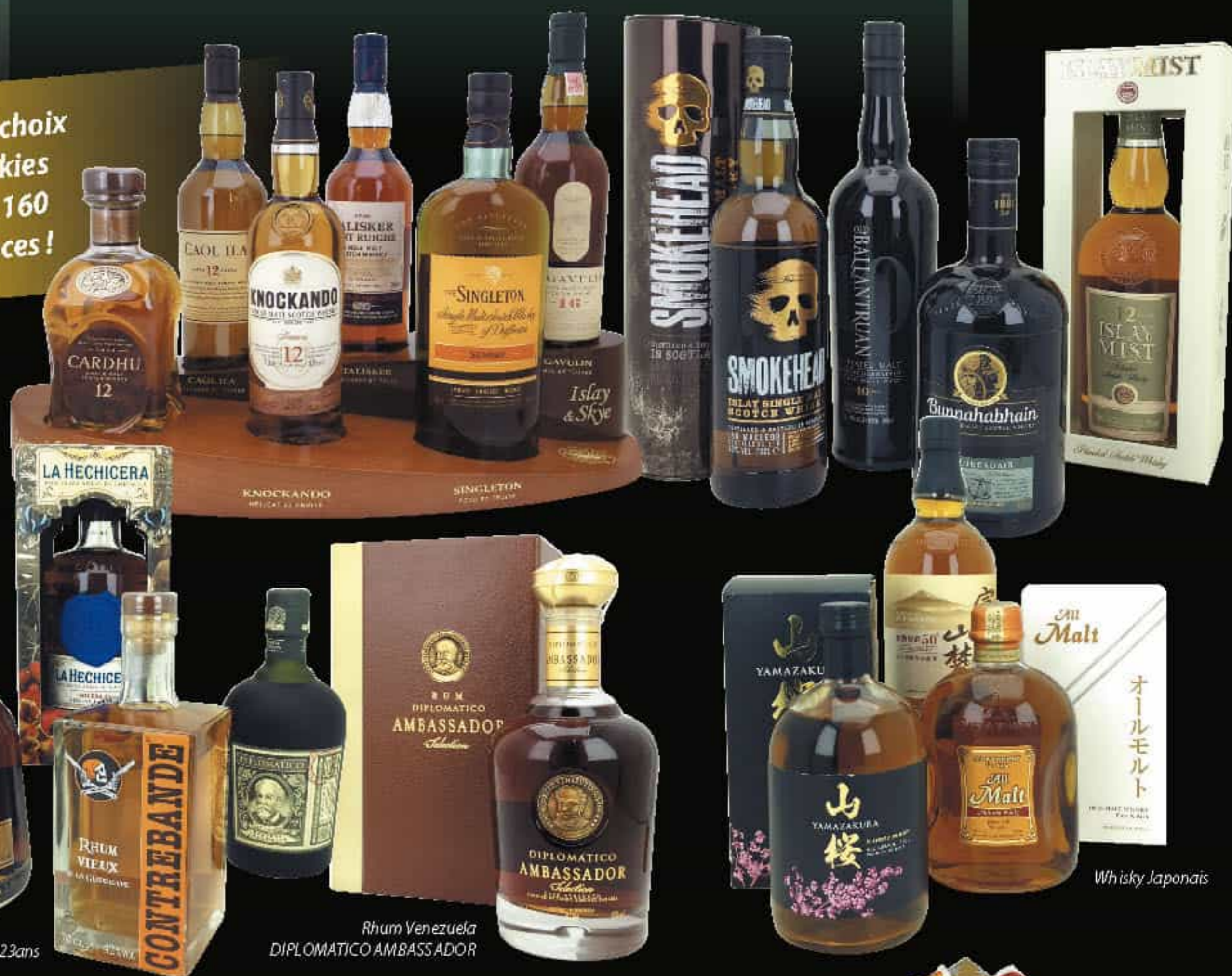
Rhum LA HECHICERA 23ans

Un grand choix de Whiskies plus de 160 références !