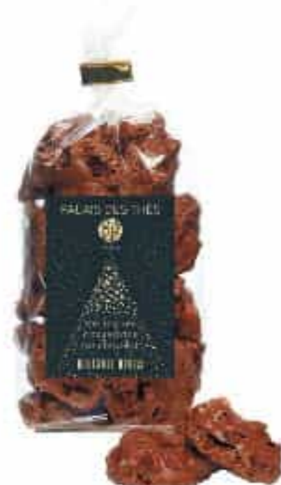
Meringues Croustillantes au Chocolat

Palais des Thés s'associe cette année à la Maison Drans, biscuiterie artisanale et familiale française, pour vous proposer des meringues et des sablés confectionnés à la main, en France, avec des ingrédients d'origine naturelle.