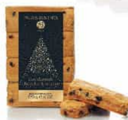
Shortbreads Chocolat et Orange